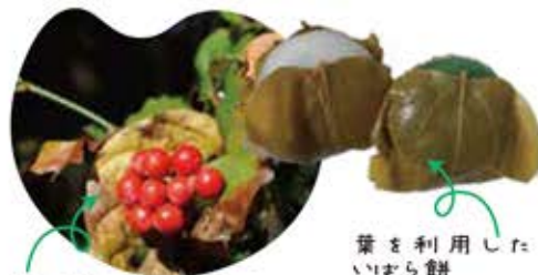
サルトリイバラの実

から冬にかけて野鳥たちの食料になります。人間は、腐りにくく色も残るその実の性質をいかして生け花などに用います。